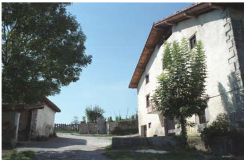
Ipintza Handi baserria, gaur egun. Erdialdean, erraldoiaren Erliebea dago. 2003ko argazkia.