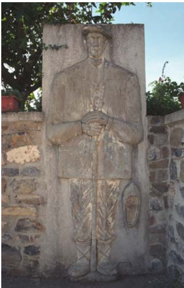
Ipintza Handi baserriaren albo batean dagoen erliebea. 2003ko argazkia.