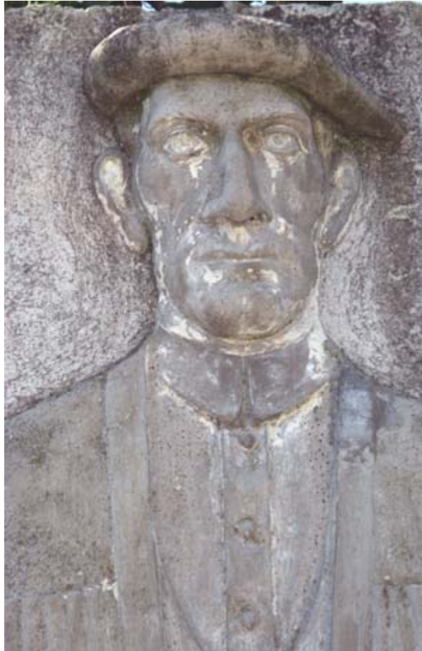
Ipintza baserriaren kanpoaldean dagoen hormigoizko erliebearen detailea. 2003ko argazkia.