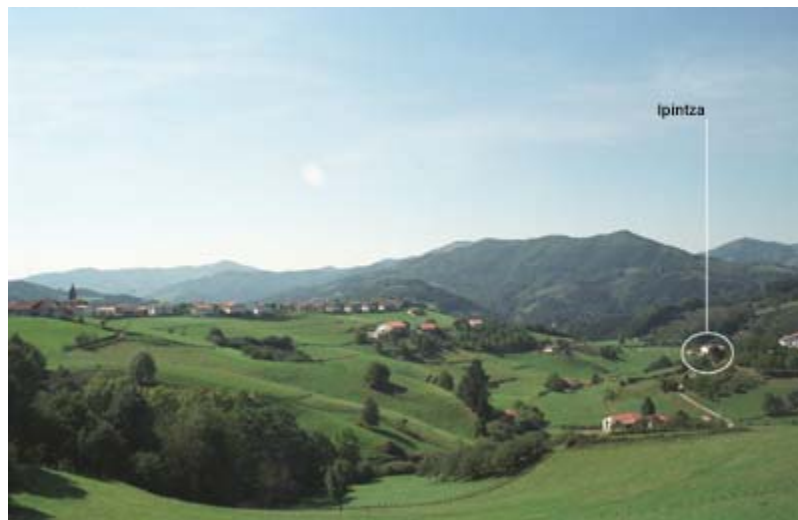
Ipintza Altzo Azpin dago. Ezkerretara, Altzo Muino ikus daiteke. 2003ko argazkia.